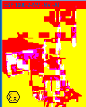
ATEX-Abfüllmaschinen ATEX-Filling Machines