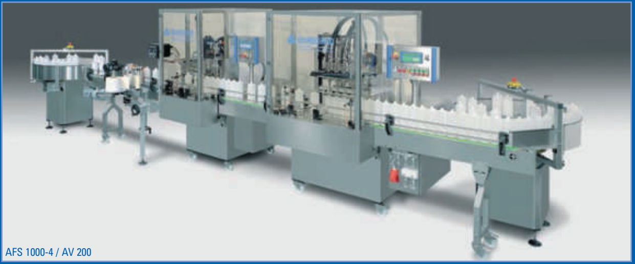
AFS 1000-4 / AV 200

Erfahrung seit über 40 Jahren. Experience since more than 40 years.