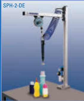
Manueller Verschrauber Manual Screwer