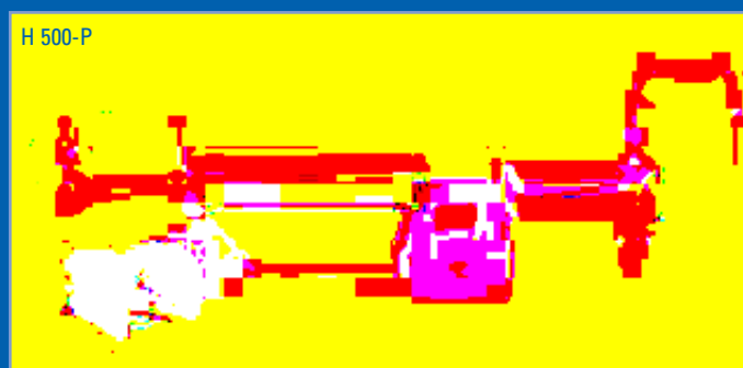
Änderungen vorbehalten / Subject to alteration